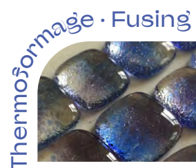
Thermoformage · Fusing